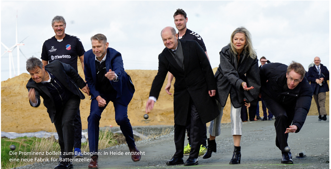
Die Prominenz boßelt zum Baubeginn: In Heide entsteht eine neue Fabrik für Batteriezellen.