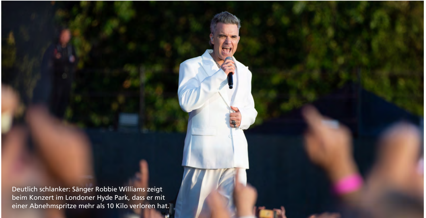
Deutlich schlanker: Sänger Robbie Williams zeigt beim Konzert im Londoner Hyde Park, dass er mit einer Abnehmspritze mehr als 10 Kilo verloren hat.